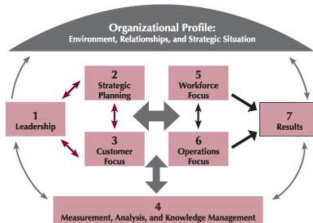
Gambar 2.1. Perspektif Malcolm Baldrige Education Criteria for Performance Excellence 2011-2012

Pada mulanya penghargaan ini muncul karena pemerintah Amerika Serikat pada saat itu menggalakkan kebutuhan akan perbaikan atau penyempurnaan kualitas dalam kaitannya dengan persaingan bisnis di Amerika dan pasar luar negeri terutama Jepang.